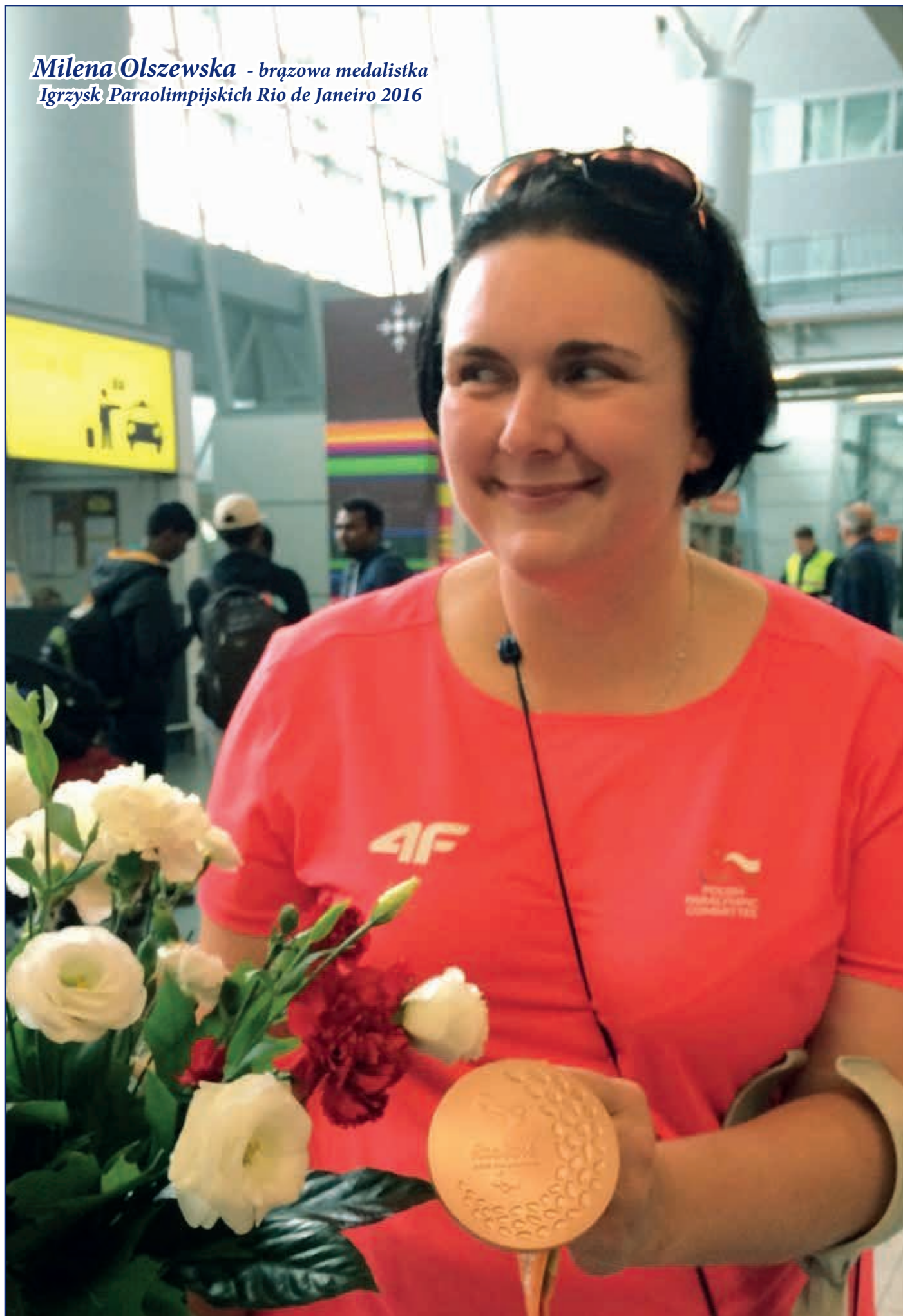
Milena Olszewska - brązowa medalistka Igrzysk Paraolimpijskich Rio de Janeiro 2016