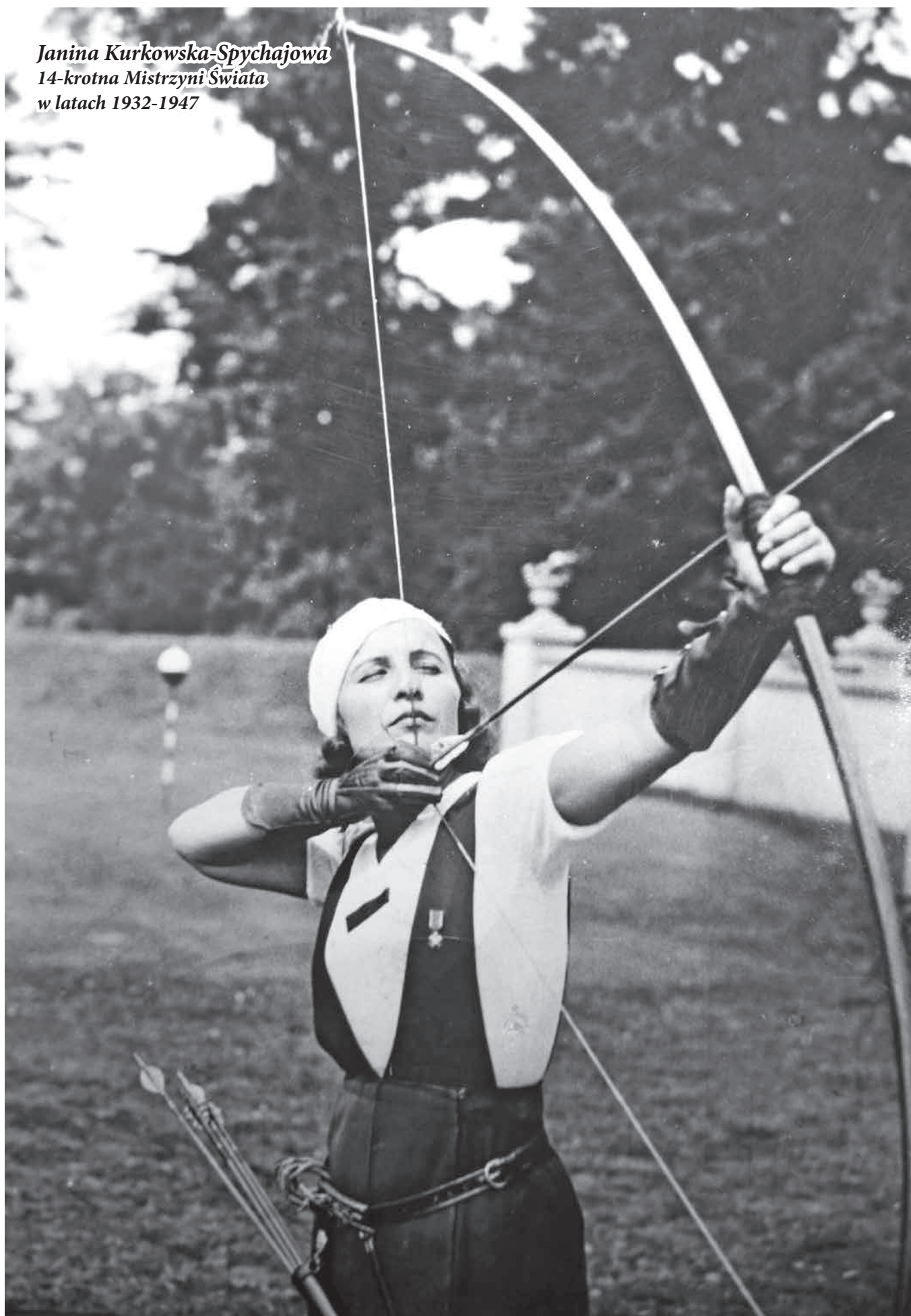
Janina Kurkowska-Spychajowa 14-krotna Mistrzyni Świata w latach 1932-1947