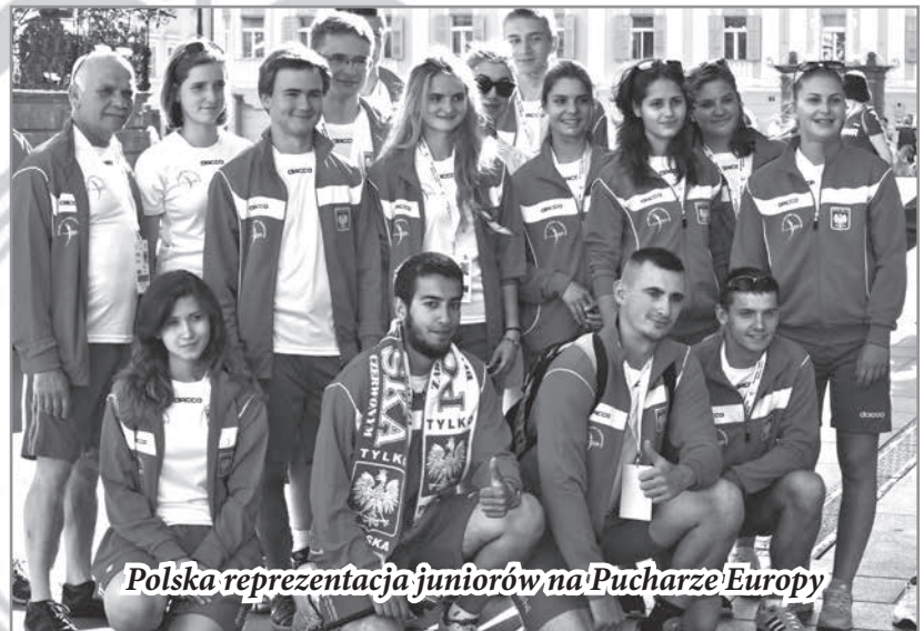
Polska reprezentacja juniorów na Pucharze Europy